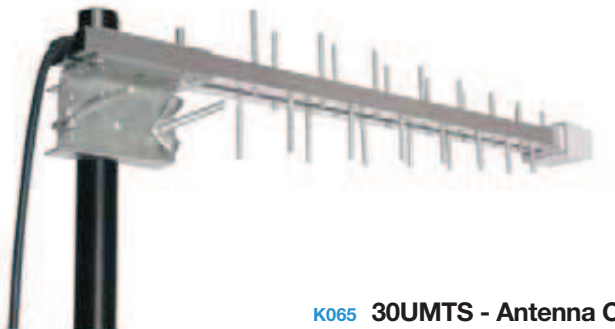
K065 30UMTS - Antenna Cellulare 30UMTS - Mobile phone antenna