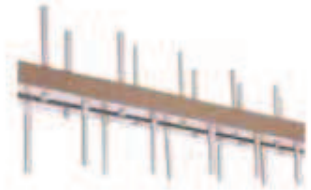
Elementi in alluminio massiccio Solid aluminium elements