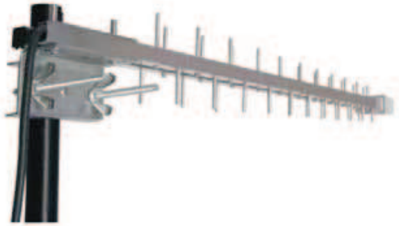
K064 44 Lan - Antenna WIFI 44 Lan - Antenna WIFI