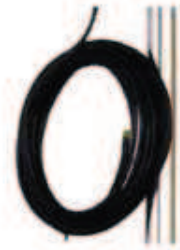
Cavo speciale Special cable