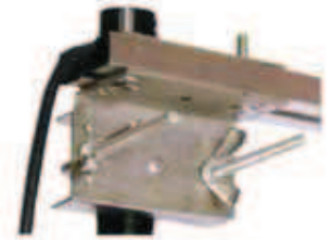
Struttura portante Carrier structure